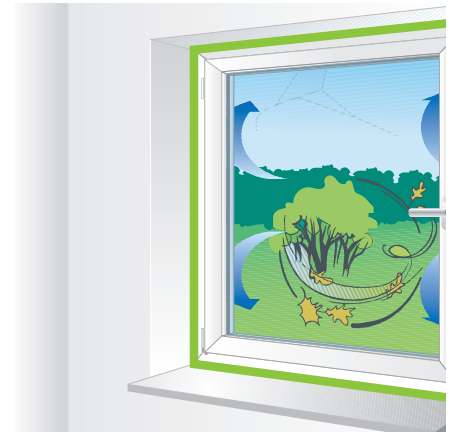
„i3“ geprüfte Qualität