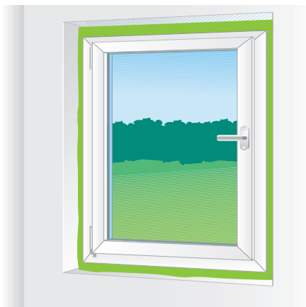
Hochelastische Verfüllung der Fensteranschlussfuge

Nur in gut belüfteten Räumen verarbeiten. Nicht rauchen! Augen schützen, Handschuhe und Arbeitskleidung tragen. Schaumspritzer sofort mit PUR-Reiniger oder Aceton entfernen. Ausgehärteter Schaum kann nur mechanisch entfernt werden. Nicht UV-beständig. Dosen aufrecht lagern. Weitere Informa-